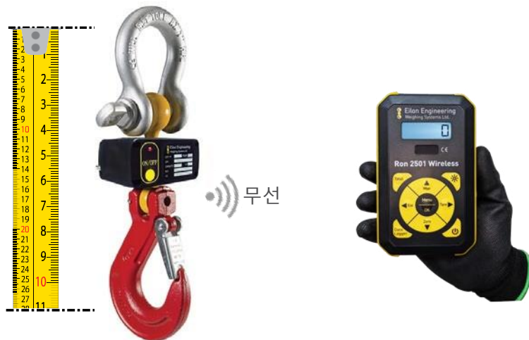
샤클 및 후크 미포함

업계에서 45년 이상의 경력 을 가지고 있으며 NASA, Boeing, Cirque du Soleil, Disney, GE, Lockheed Martin 등 Fortune 500대 기업 및 수많은 중소기업과 지속적으로 거래하고 있습니다.